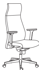
80012 h1280 . d660 . w660