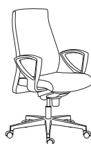
80021 h1060 . d660 . w660