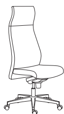
80010 h1280 . d660 . w660

Die Rückenlehne ist seine Stärke. Dank seiner geschwungenen Linie passt sich Energy den Körperformen perfekt an und bietet einen einzigartigen und unbezahlbaren Komfort. Die ansprechende Form der fixen Armlehne bildet eine Einheit mit der Schale. Das Ergebnis ist der perfekte Stuhl für ein dynamisches und extravagantes Ambiente.