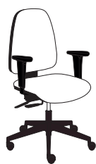
18371 h1110 . d620 . w620

Wie der größere Bruder garantiert auch Comfort Jolly die gleiche Bequemlichkeit und Funktionalität, wobei noch mehr Wert auf die wesentlichen Eigenschaften gelegt wird. Ein Drehstuhl, der gedacht ist für Kunden, die einen schlichten, aber qualitativ hochwertigen Stuhl wollen, der Tag für Tag für überraschenden Komfort und Zweckmäßigkeit sorgt.