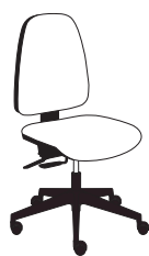
18373 h1110 . d620 . w620