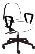
18362 h1010 . d620 . w620